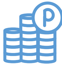
ポイントの確認とご利用