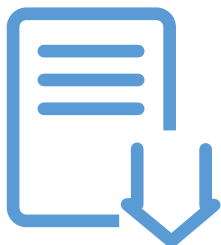
周知文書のダウンロード