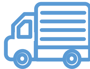
お引越しの際のご連絡