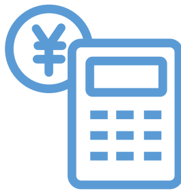
ご利用明細の確認

毎月のご利用明細の確認や、ポイントの確認なども行えます。修理依頼やご連絡事項の際には、お名前などを入力せずにご依頼いただけます。もちろん、応急処置は無料です。